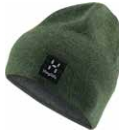
z.B. HAGLÖFS Woolly Beanie

Die ideale Bekleidung für Klettersteige sollte funktionell sein und im Zwiebelprinzip in mehreren Schichten aufgebaut sein. Dies ermöglicht bei jedem Wetter und bei allen Verhältnissen einen hohen Klimakomfort: