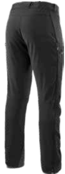
z.B. HAGLÖFS Roc Fusion Pant