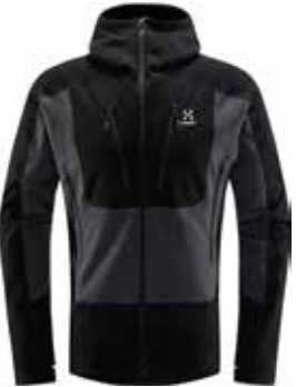
z.B. HAGLÖFS Serac Hood