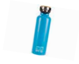
z.B. SEA TO SUMMIT 360° Trinkflasche