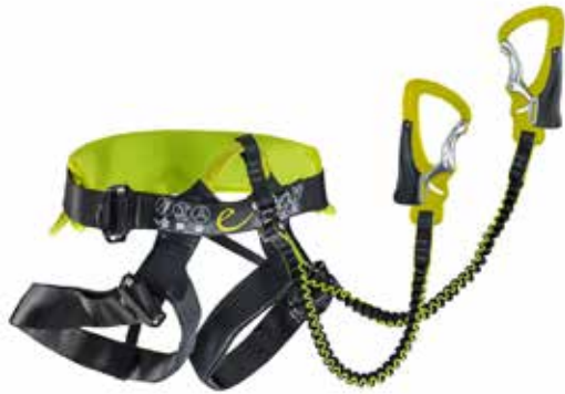
z.B. EDELRID Jester Klettersteigset