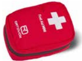
z.B. ORTOVOX 1.Hilfe Set/Reiseapotheke