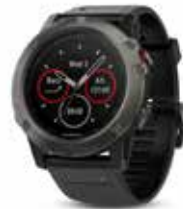
z.B. GARMIN Fenix 5

Für die meisten Touren gilt: Weniger ist mehr. Denn ein unnötig schwerer Rucksack kann den Erfolg einer jeden Tour gefährden. Die aufgeführten Ausrüstungsgegenstände sollten bei keiner Unternehmung fehlen: