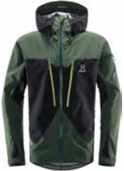
z.B. HAGLÖFS Spitz Jacket