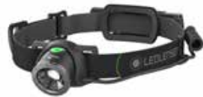
z.B. LED LENSER MH10