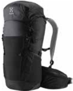
z.B. HAGLÖFS Spira 35