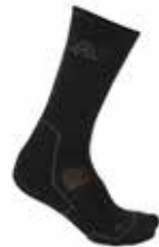
z.B. ACLIMA Socken