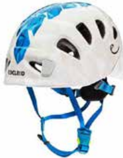
z.B EDELRID Helm Shield Lite