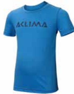
z.B. ACLIMA LightWool T-shirt