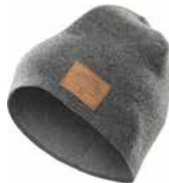
z.B. HAGLÖFS Whooly Beanie