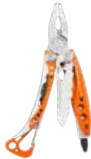
z.B. LEATHERMAN Skeletool RX