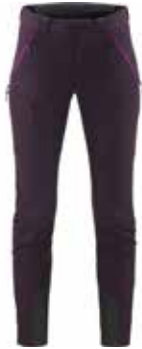
z.B. HAGLÖFS Roc Fusion Pant