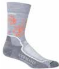
z.B. ICEBREAKER Socken aus Merinowolle