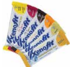
z.B. XENOFIT Energieriegel