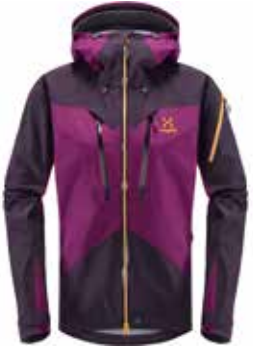
z.B. HAGLÖFS Spitz Jacket