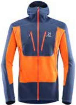
z.B. HAGLÖFS Serac Hood