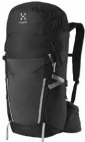
z.B. HAGLÖFS Spira 35