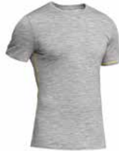
z.B. ICEBREAKER Anatomica Shirt

Die ideale Bekleidung für Klettersteige sollte funktionell sein und im Zwiebelprinzip in mehreren Schichten aufgebaut sein. Dies ermöglicht bei jedem Wetter und bei allen Verhältnissen einen hohen Klimakomfort: